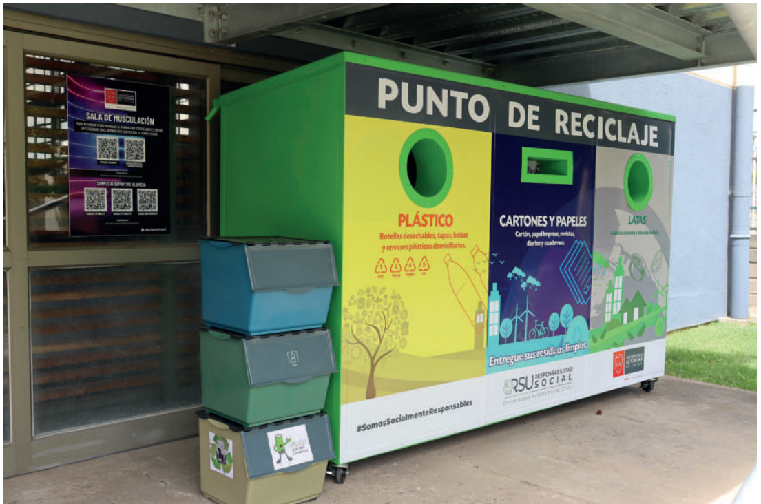
PUNTO VERDE DE LA SEDE DE TALCA

Promover una cultura y gestión universitaria socialmente responsable, sostenible, transversal, evaluable y reportable, en adecuación permanente a las necesidades del entorno y a la misión pública y social de la Universidad, en el marco de sus compromisos institucionales con la sostenibilidad en todos sus ámbitos.