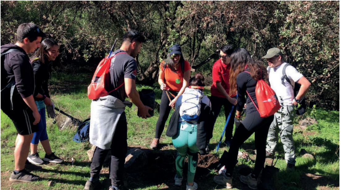
ACTIVIDAD DE SOSTENIBILIDAD Y RESPONSABILIDAD SOCIAL

5 Desarrollar gradual y progresivamente la investigación, producción académica y transferencia de conocimientos, según compromisos institucionales relativos a la sostenibilidad.