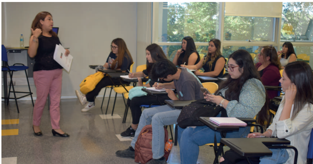
INICIO DE CLASES ESTUDIANTES VESPERTINO