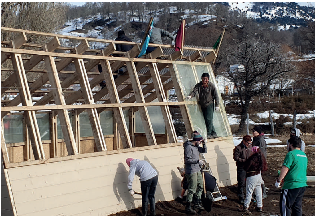
VIVENCIAS AUTÓNOMA ICALMA

La Universidad Autónoma de Chile promueve la transversalidad y la integralidad de la respuesta a los desafíos de una gestión universitaria socialmente responsable y sostenible, entregando un marco de referencia que incentiva un quehacer acorde en las áreas claves de gestión, docencia, investigación y vinculación con el medio.