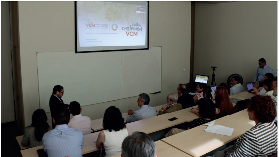
PRESENTACIÓN PLAN VCM PROVIDENCIA 2022

9 Orientar gradual y progresivamente la gestión académica y sus procesos al cumplimiento de los compromisos institucionales con la sostenibilidad.