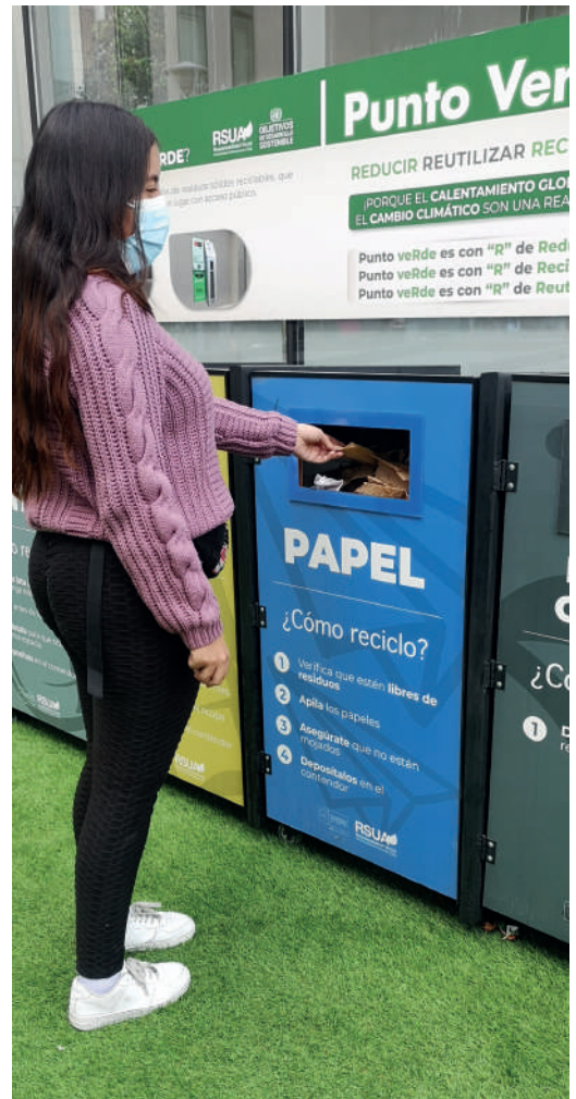
PUNTO DE RECICLAJE, SEDE PROVIDENCIA