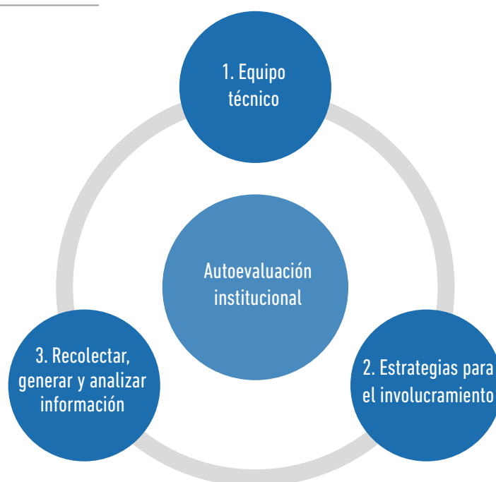
FIGURA 2: Recomendaciones para el proceso de autoevaluación

Para que un proceso de autoevaluación se desarrolle de manera adecuada y aporte a la mejora continua, es importante considerar algunos factores que contribuyen a un buen desarrollo del proceso: