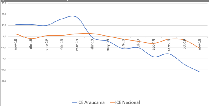
Gráfico 2 Trimestre móvil / ICE Araucanía - ICE Nacional / nov. 2018 - nov. 2019 (Índice centrado en cero)

Respecto del sector Agropecuario y Forestal , en La Araucanía se mantuvo "pesimista" y, a nivel nacional, registró una caída de dos niveles, desde "pesimista" a "extraordinariamente pesimista". Así, el ICE Araucanía de este sector se situó dos niveles sobre el ICE Nacional.