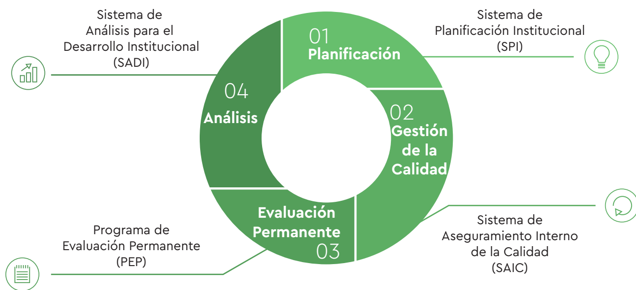
Figura N°1: Sistemas del Modelo de Aseguramiento de la Calidad